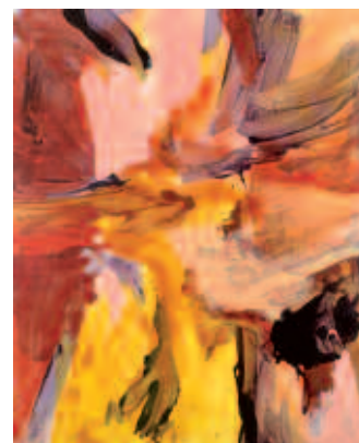
Boven: invullen svp